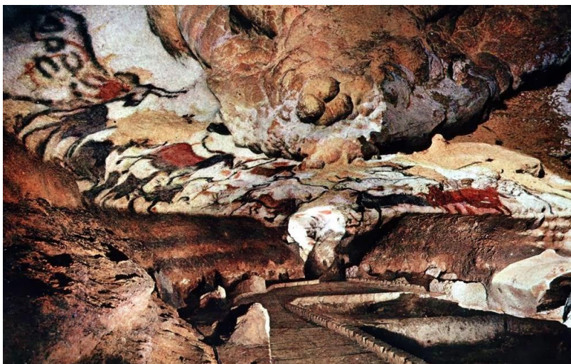
Caverna de Lascaux

A Caverna de Lascaux é muito importante para a arqueologia, devido à grande quantidade de pinturas rupestres em seu interior. Estas pinturas nos ajudam a compreender e imaginar como nossos antepassados viviam na pré-história. Lá eles ilustravam suas cenas de caça e desenhos de animais que desvendam o cotidiano de uma cultura milenar. As imagens de cavalos são as mais numerosas. Há também veados, bisões e bóvidos extintos, como auroques.