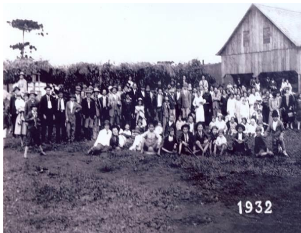
1932 – Vila Encruzilhada (todos os moradores)