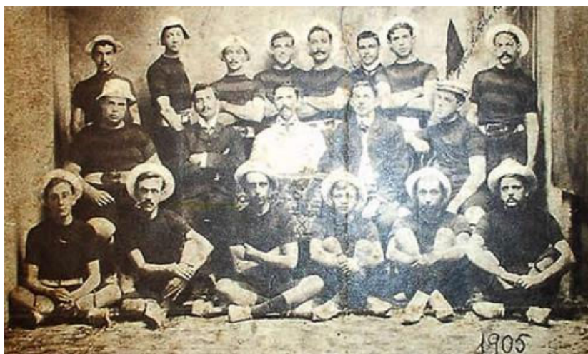
Time do Sport (1905)

O início das ligas de futebol no país aconteceu em São Paulo, em 1901. Logo depois, em 1905, a do Rio de Janeiro já estava formada. Dez anos depois, em 1915, havia registros em Pernambuco, Minas Gerais, Rio Grande do Sul, Bahia e Paraná.