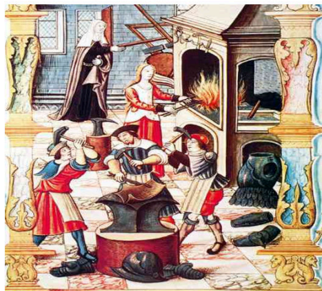
A divisão de trabalho era uma característica das nascentes manufatureiras. Miniatura representando uma forja francesa do século XVI. A litografia pertence à obra Chants royaux miniatures sur la conception couronnée du Puy de Rouen.