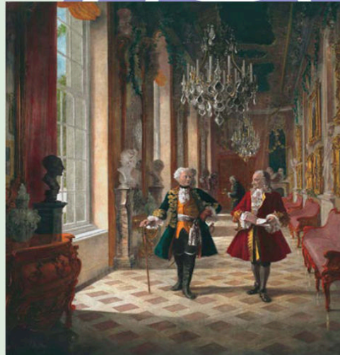
Frederico II, o Grande, e Voltaire em Sanssouci, litogravura colorida sobre pintura de Georg Schöbel, 1860.