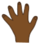
Ilustração: Ferenada Comics

ERA UMA BRUXA À MEIA-NOITE EM UM CASTELO MAL-ASSOMBRADO COM UMA FACA NA MÃO PASSANDO MANTEIGA NO PÃO