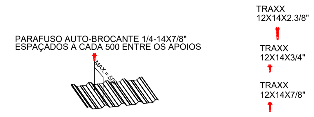
DETALHE DE FIXAÇÃO S/E