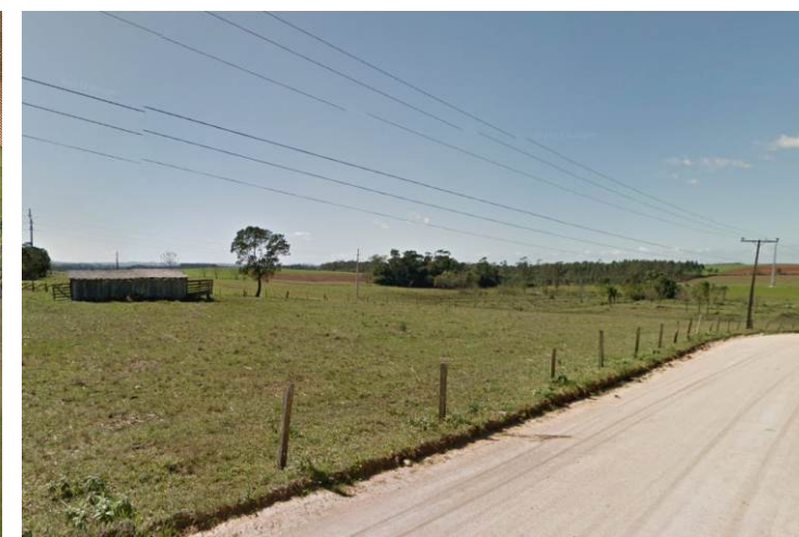
Vista do Pedestre - ICR - 472