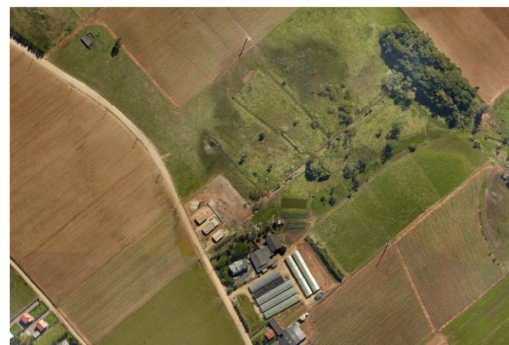
Vista Aérea - Recorte ZI 2