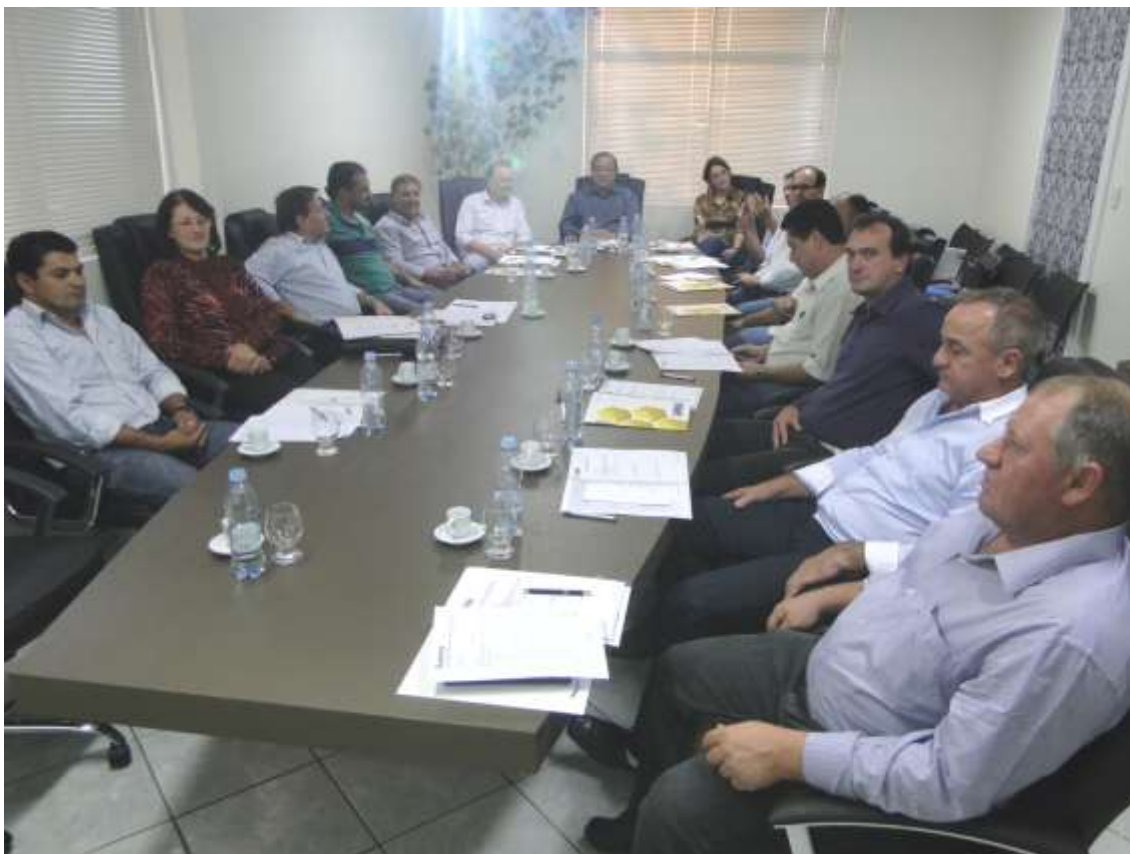
Primeira Assembleia realizada na nova Sala de Reuniões da AMAI.