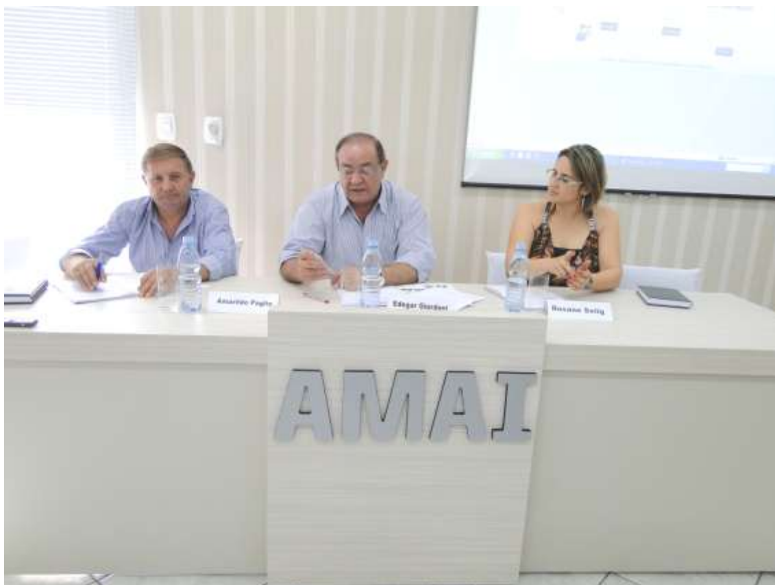
Diretoria Executiva da AMAI, conduzindo primeira Assembleia de trabalhos de 2013.