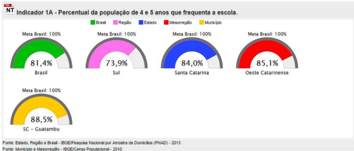
Gráfico 3. Percentual da população de 4 a 5 anos que frequenta a escola em nosso município. Fonte: <www.pne.mec.gov.br>. Acesso em: 14 abr. 2015.

É garantido atendimento a toda demanda, observando um custo aluno/ano de $ 641.22/mês (seiscentos e quarenta e um reais e vinte e dois centavos).