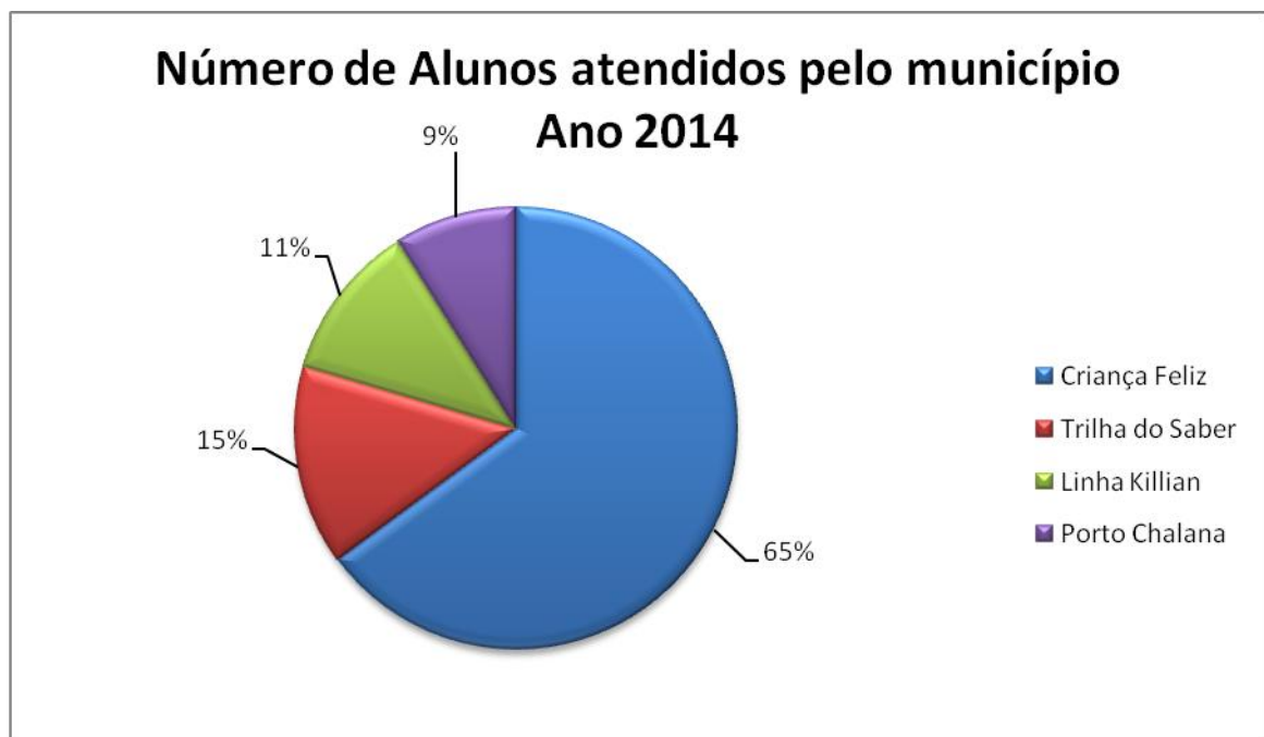
Gráfico 1. Número de alunos atendidos pelo município – ano 2014.